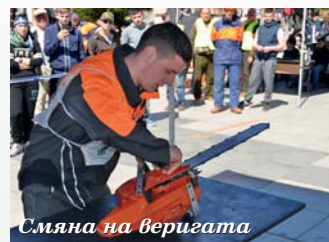
Смяна на веригата