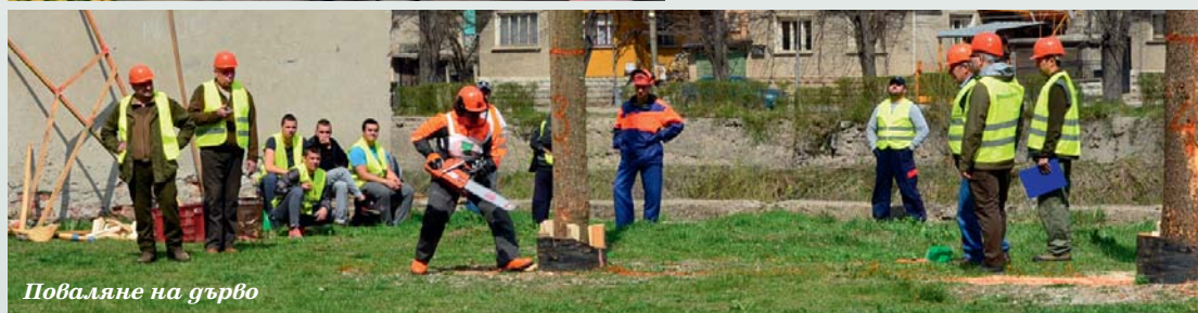
Поваляне на дърво