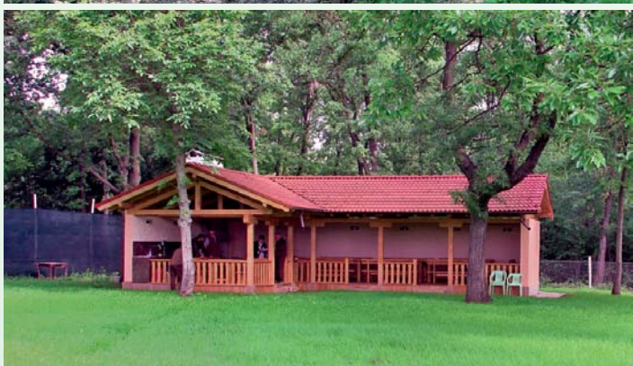
БИРД и нейните обитатели

благодарност към хората, които още изпълняват тази трудна мисия. Фазанът и от двата вида - монголски и корейски, все още се отглежда. Но, уви, в размери, десетократно по-малки отпреди. СЦДП има грижата да субсидира дейността в рамките на възможностите си. Тази година 2200 фазана от „пълната гържавна издръжка“ ще се преселят в свободния свят на природата.