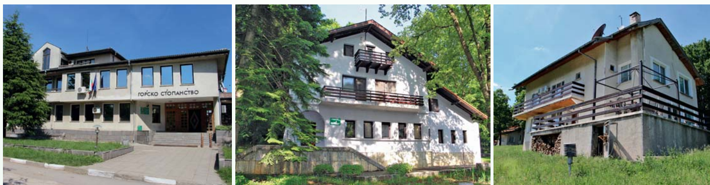
Сградата на ДГС „Сеслав“ и ловните домове „Фазан“ и „Елен“