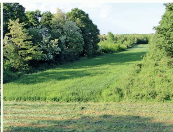
Биотехническите съоръжения в ловния участък

постройка, която се казва „Дом на животновъда“. Още през септември същата година тя е основно ремонтирана, обзаведена и открита като красив Ловен дом „Елен“. Не по-малко красива в ансамбъла на гр. Кубрат е и сградата на администрацията на сегашното ДГС „Сеслав“. Тя също се строи под ръководството на инж. Руси Русев. Финансирането на строителството е 50 % със собствени средства, за които ОЛТ играе решаваща роля. Първата копка на сградата е направена през 1993 г. и през пролетта на 1997 г. се очаква тържественото ѝ откриване. Но успешният директор не прерязва лентата. Същата година е уволнен от служебното правителство, оглавявано от Стефан Софийански. Политическите кадри в системата вече се развихрят и един непримирим пред галаверите ръководител става... излишен.