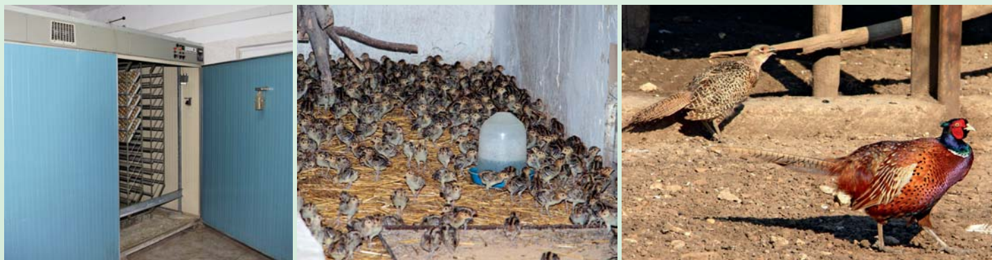
Фермерното отглеждане на фазани

Като се обърне назад, инж. Русев не вижда никакво „разграждане“, а само надграждане - всяка година в стопанството все нещо се строи, разширява се, ремонтира се, допълва се. През 1984 г. напълно е реновиран Ловният дом „Фазан“, който и до ден днешен се посещава от чуждестранните ловци. В началото на 1993 г. при ликвидацията на местното ТКЗС стопанството придобива за 30 000 лв. една изоставена