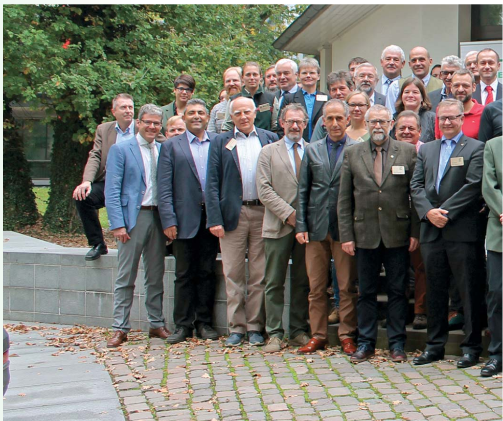
Участниците в международния семинар от Съюза на европейските лесовъди, от Европейската асоциация на общините собственици на гори и официалните гости

Важен акцент в изказванията бе влиянието на климатичните промени и необходимостта да се прилагат изискванията на природосъобразното стопанисване, особено в Югоизточната част на Европа, където се очертават ясно проблеми със здравословното състояние на горите (съхнене, гъбни болести и нападения от насекоми вредители). Налага се лесовъдската колегия в тази част на Европа да работи в условия на нарастващ