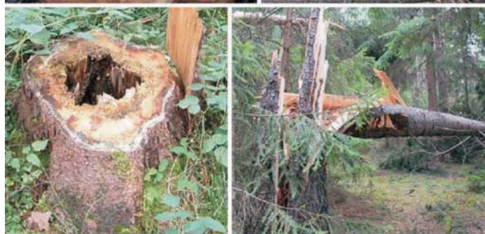
Фиг. 2. Характерни повреди от кореновата гъба Heterobasidion annosum