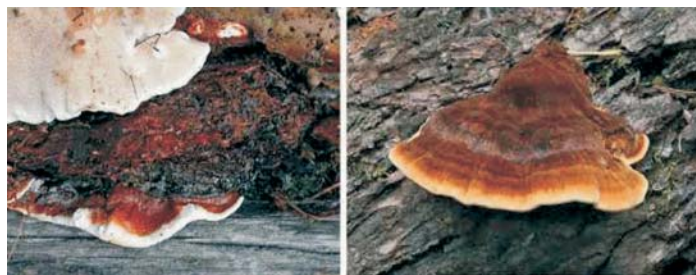
Фиг.1. Плодни тела на кореновата гъба Heterobasidion annosum (Fr.)Bref