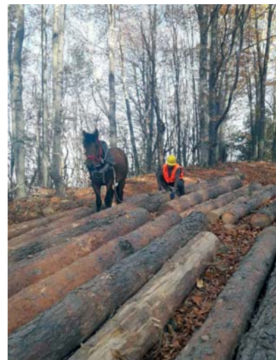
Екологичен извоз на дървесина с коне

Стопанисваните от ДЛС „Росица“ държавни горски територии са разположени почти изцяло на стръмни и много стръмни терени (82.5 %), което обуславя слабо развитата пътна мрежа и наличието на недостъпни басейни. За по-правилно планиране на стопанските дейности през 2018 г. със средства от фонд „Инвестиции в горите“ започна изграждането на два нови пътя с обща дължина 12 километра. След тяхното завършване ще се осигури транспортен достъп до два от затворе-