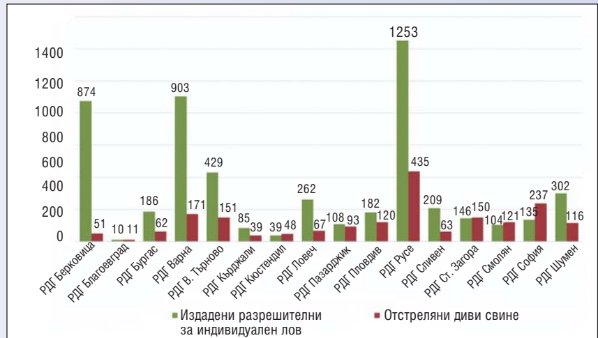
Фиг. 2. Издадени разрешителни за индивидуален лов на дива свиня и отчетено ползване за периода 18.07.2018 - 20.01.2019 г.

Във връзка с проведено заседание на Ловния съвет към ИАГ на 16.08.2018 г. е взето решение за изменение на чл. 54, ал. 2 от