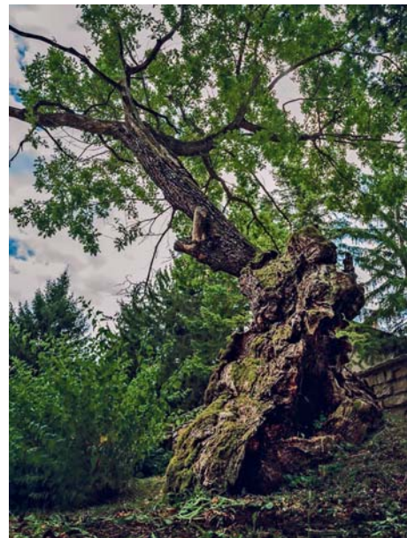
Петвековният дъб от с. Ново село

Журиито връчи на Димо Троянчев от Пазарджик специална награда за изпратената от