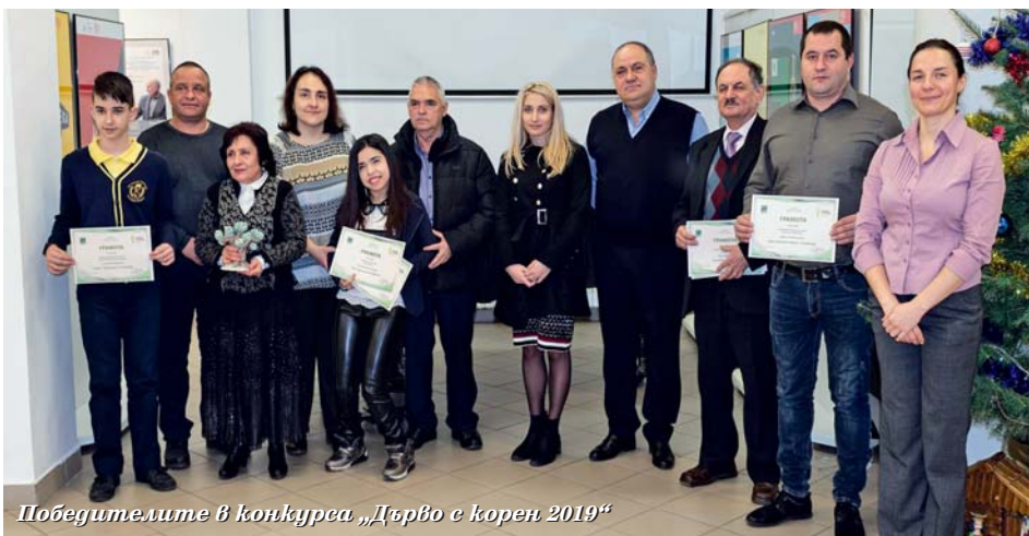
Победителите в конкурса „Дърво с корен 2019“