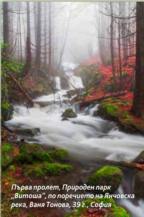
Първа пролет, Природен парк „Витоша“, по поречието на Янчовска река, Ваня Топова, 39 г., София