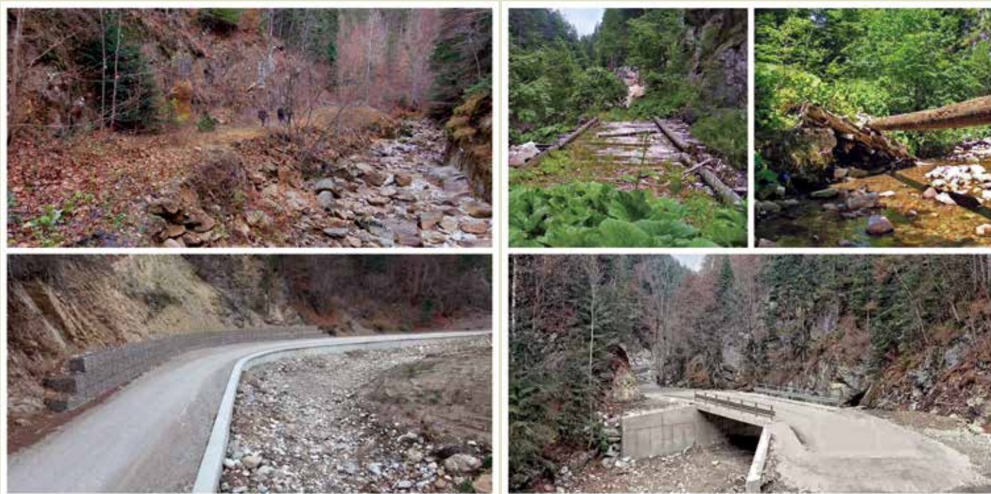
Отсечки на новопостроения автомобилен път Тешел – Мугла – преди и сега

Така нарекохме ние горския автомобилен път от 18 км, който преминава през Държавните горски стопанства в Смолян и Триград и Държавното ловно стопанство „Извора“ – Девин. Красива гледка е проходът между Тешелските скали, обрасли с гори, най-вече с уникалния тешелски бор, чиито стъбла изникват от камъка. Тук е резерватът „Казаните“, чието име потвърждават завъртащите се в дълбините води на реката Мугленска. Пътят се набира в безброй завои, но се пътува леко. „Летим“ с 50 км в час. Голяма работа е това, сериозно, защото допреди година-две по него не е било възможно да се кара кола, а камо ли натоварена с дървесина! Реката се пресича от нашето возило безброй пъти. Вече се пресича, трябва да кажем. Защото 18-километ-