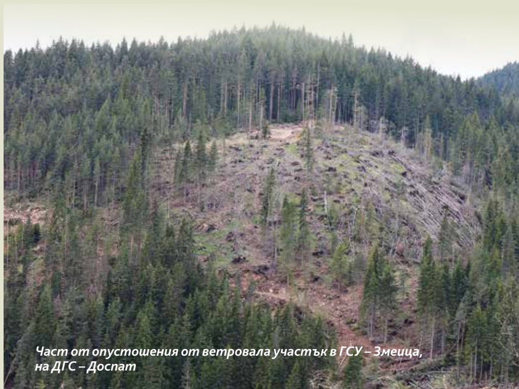
Част от опустошения от ветровала участък в ГСУ – Змеица, на ДГС – Доспат