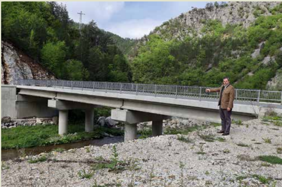
Кой не би се гордял с такива пътища в гората