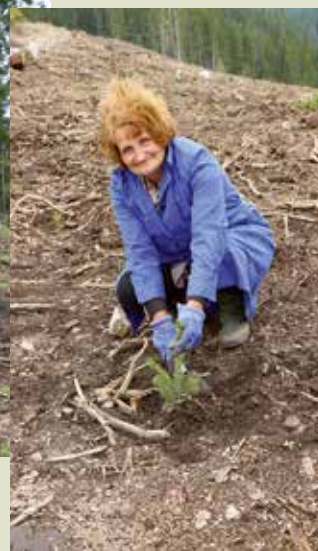
Залесяват работниците от собствени бригади на ДГС – Доспат, и помощниците от ДЛС „Широка поляна“