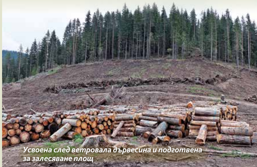
Уسوена след ветровала дървесина и подготвена за залесяване площ