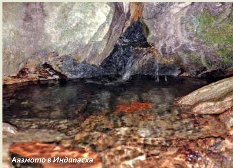
Аязмото в Индипасха

дите, надиграване и изпълнения на традиционен странджански фолклор, размисък с местните хора.