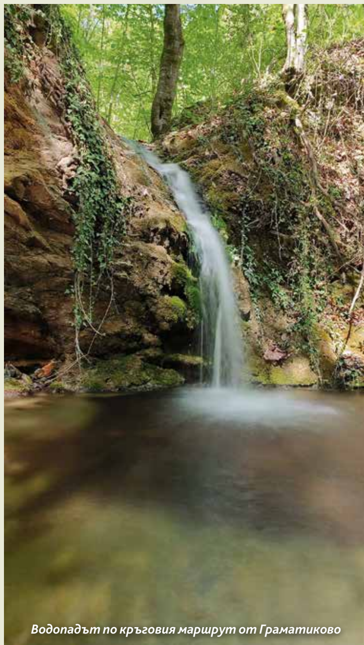
Водопадът по кръговия маршрут от Граматиково

На 11 май под звуците на химна на българската гора „Хубава си, моя горо“ и на Странджа – „Ясен месец веч изгрява“, присъстващите на откриване-