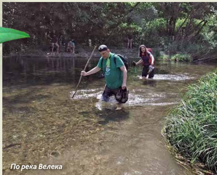
По река Велека

В същото време на площада в селото се виеха хора и се лееше странджанска музика. В по-късните сле- добедни часове се проведеха игри за най-малките по методите на горската педагогика и състезание „Мама, татко и аз“, като гостите се наслаждаваха на продук- цията на местните производители. Вечерта беше за- пален фестивалният огън, последва вечеря под звез-