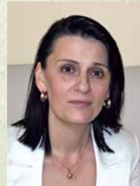
40. Д-р инж. Валентина Маринова - зам.-министър на земеделието и храните (1 юли 2013 - 6 август 2014 г.)