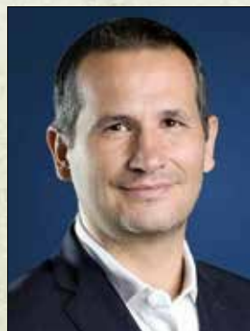
48. Иван Христанов - зам.-министър на земеделието (21 декември 2021 - 2 август 2022 г.)