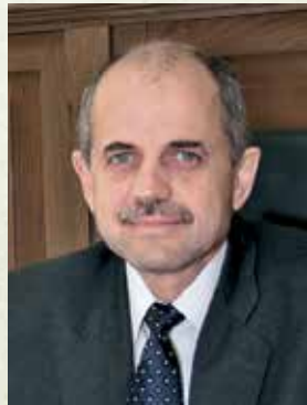
37. Доц. Георги Костов - председател на ДАГ (29 юли - 23 октомври 2009 г.), зам.-министър на земеделието и храните (23 октомври 2009 - 8 септември 2011 г. и от 8 август 2014 до 26 януари 2017 г.)