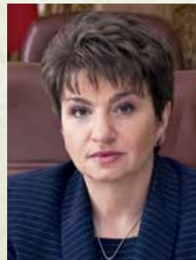
34. Д-р инж. Меглена Плужчиева - зам.-министър на земеделието и горите (3 септември 2001 - 8 ноември 2004 г.)