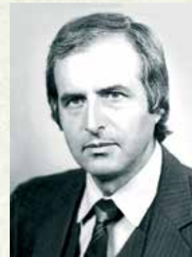
24. Проф. Иван Раев - председател на Комитет по горите към МС (21 януари 1991 - 8 октомври 1992 г.)