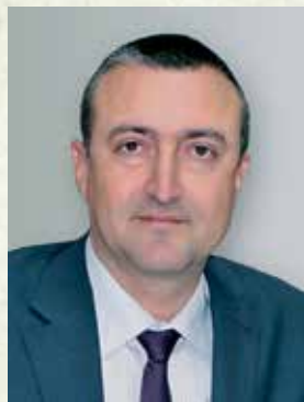
43. Атанас Добрев - зам.-министър на земеделието, храните и горите (12 май 2017 г.)