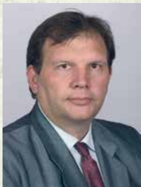
42. Проф. Иван Палигоров - зам.-министър на земеделието и храните (2 февруари - 12 май 2017 г.)