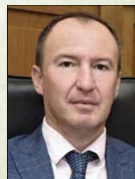
50. Инж. Валентин Чамбов - зам.-министър на земеделието (от 27 април 2022 - 6 юли 2023 г.)